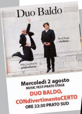
Mercoledì 2 agosto MUSIC FEST-PRATO STAGE DUO BALDO, CONdivertimentoCERTO ORE 22:30 PRATO SUD