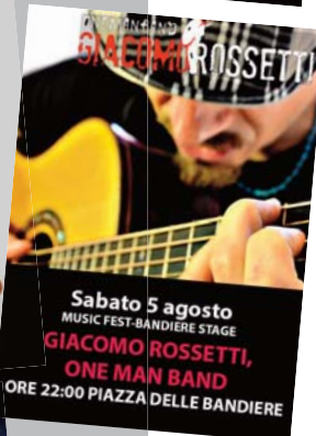
Sabato 5 agosto MUSIC FEST-BANDIERE STAGE GIACOMO ROSSETTI, ONE MAN BAND ORE 22:00 PIAZZA DELLE BANDIERE