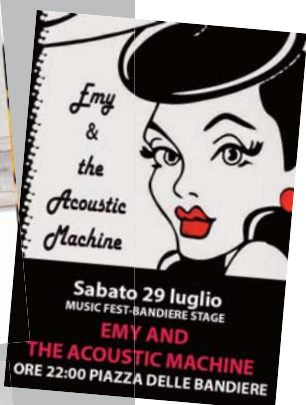
Sabato 29 luglio MUSIC FEST-BANDIERE STAGE EMY AND THE ACOUSTIC MACHINE ORE 22:00 PIAZZA DELLE BANDIERE