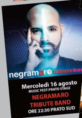
Mercoledì 16 agosto MUSIC FEST-PRATO STAGE NEGRAMARO TRIBUTE BAND ORE 22:30 PRATO SUD