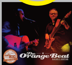
Sabato 22 luglio MUSIC FEST-BANDIERE STAGE ORANGE BEAT DUO ORE 22:00 PIAZZA DELLE BANDIERE

Vi segnaliamo gli eventi ed il cinema serale per bambini, le numerose serate con musica dal vivo e in particolare la consueta rassegna "PUNTA ALA MUSIC FEST" che questa stagione ospiterà 8 concerti di alta qualità tra il Prato Sud e Piazzetta delle Bandiere. Concluderanno la stagione, secondo tradizione, i fuochi d'artificio in zona Prato Sud.