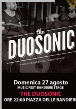
Domenica 27 agosto MUSIC FEST-BANDIERE STAGE THE DUOSONIC ORE 22:00 PIAZZA DELLE BANDIERE