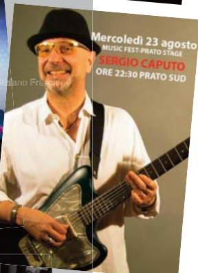
Mercoledì 23 agosto MUSIC FEST-PRATO STAGE SERGIO CAPUTO ORE 22:30 PRATO SUD